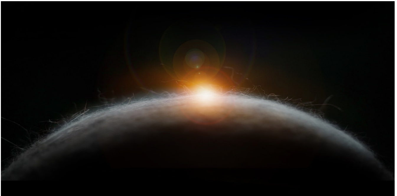
伍韶勁 · 《33.8 Hz》 · 2024 (影像截圖)

從交織聲音和光影的沉浸式藝術，到多個參與集體多媒體創作的機會，CHAT六廠的2024年夏季展覽將帶來多元化的精彩體驗