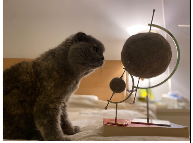
藝術家的貓 Whisky 凝視着兩個為《寰》準備的毛球