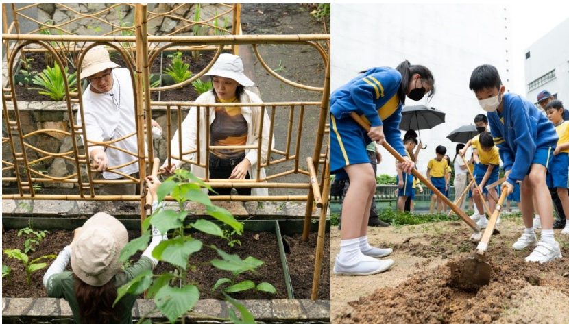
「菠蘿核」與本地學生組成的種子隊種植用於自然染及可供食用的植物

今年，CHAT 六廠的年度旗艦社區計劃「種學織文」將展示 CHAT 六廠駐場藝術家團隊「菠蘿核」和不同社群的合作成果。菠蘿核深入探討海外華僑農場與香港豐富移民歷史所交織的故事，透過景觀裝置、集體種植和創作以及影視作品，分享他們的研究成果與藝術實踐。